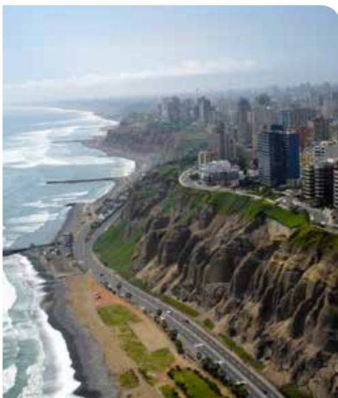
Costa verde, Lima, Perú