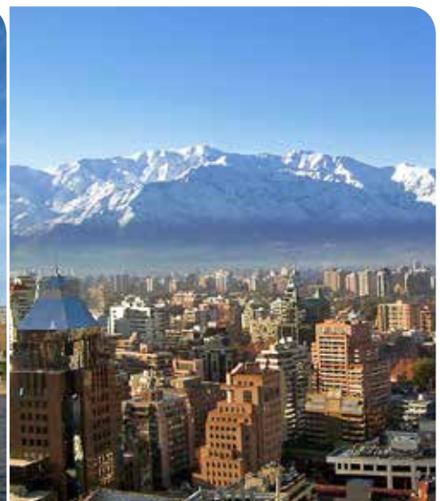
Centro financiero, Santiago, Chile