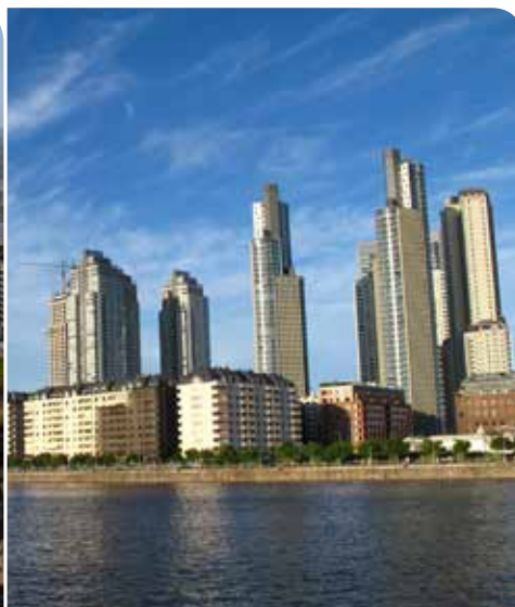
Puerto Madero, Buenos Aires, Argentina