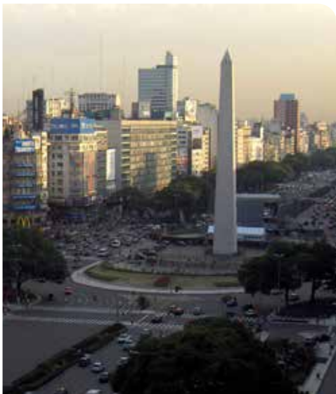
Obelisco de Buenos Aires, Argentina.