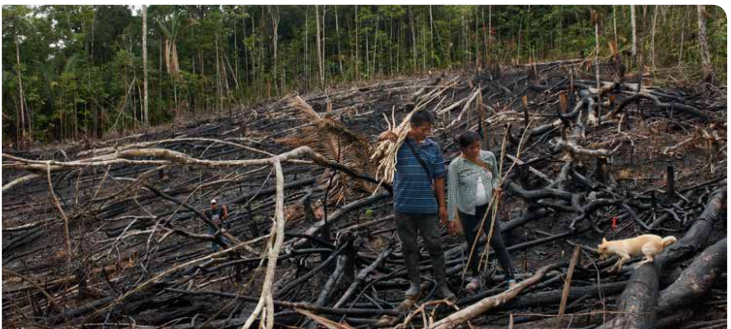
Deforestación para la agricultura.