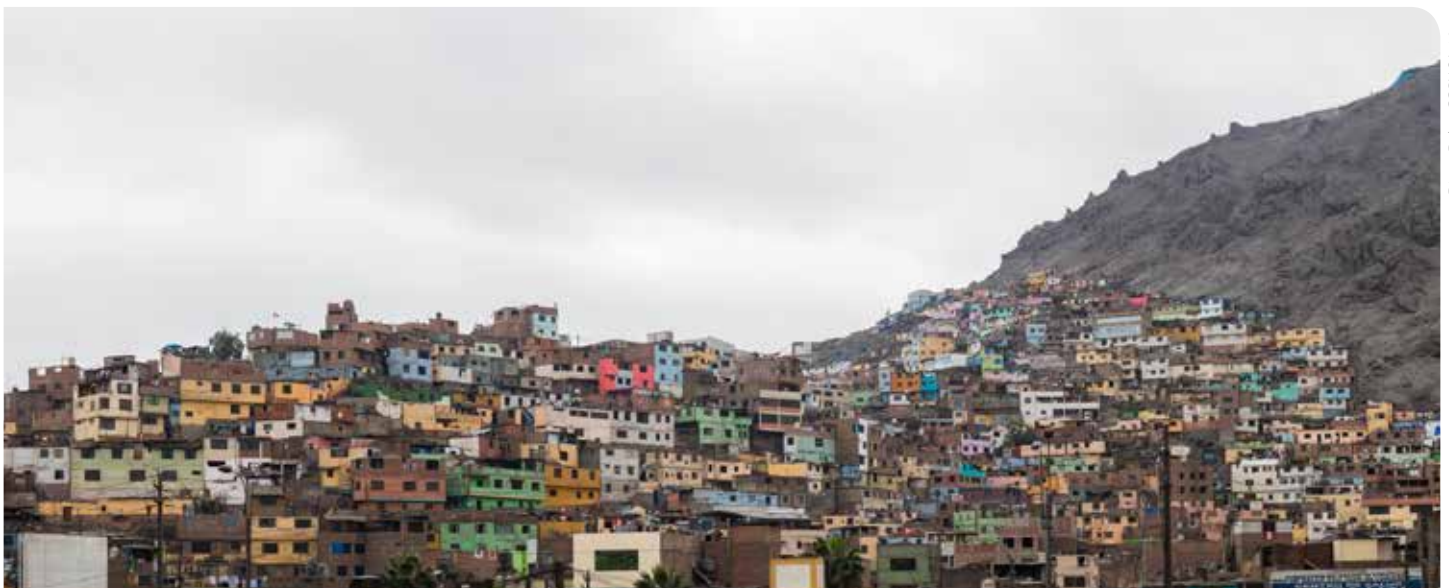
Cerro San Cristóbal, Lima, Perú