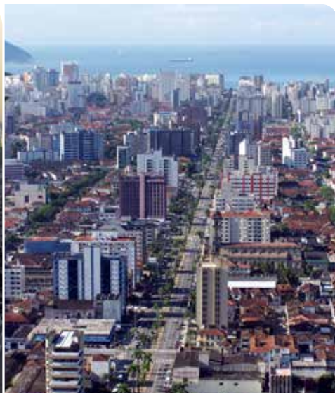
El área insular de Santos, São Paulo, Brasil.