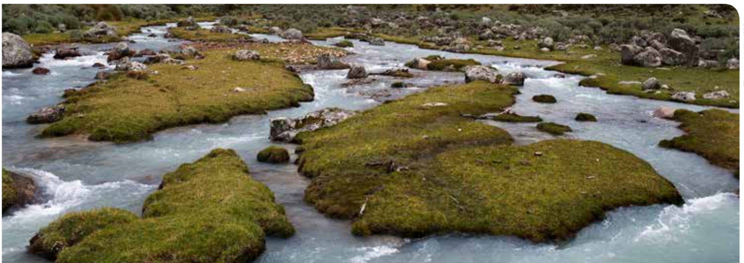
Cuenca de río en las partes altas de Perú.