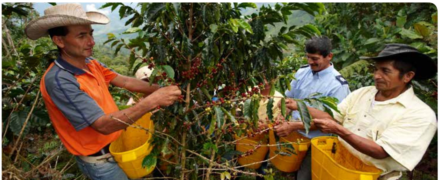
Agricultores cosechando café.