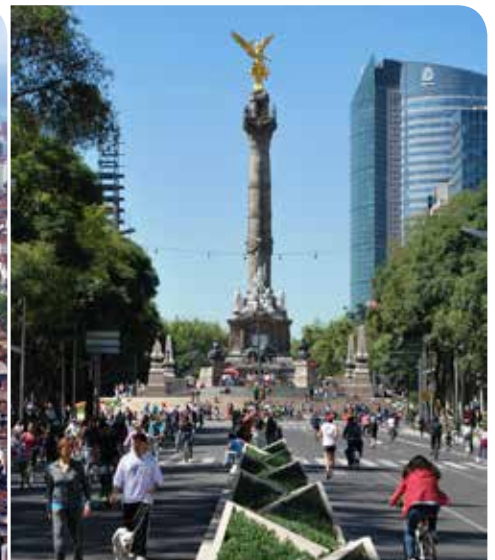
Monumento El Ángel, Ciudad de México.