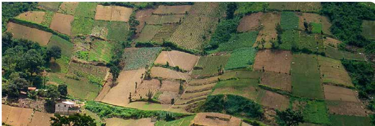
Campos de cultivo en Quetzaltenango, Guatemala.