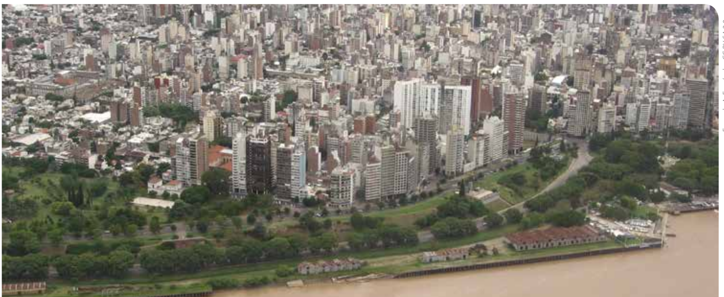
Ciudad de Rosario.