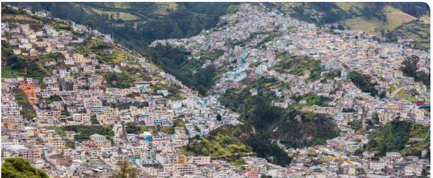
Típicas barriadas coloridas de Quito vistas desde El Panecillo.