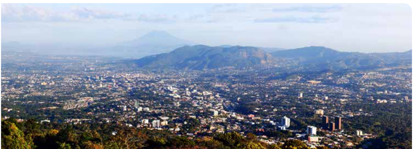
Panorámica del Área Metropolitana de San Salvador, El Salvador.