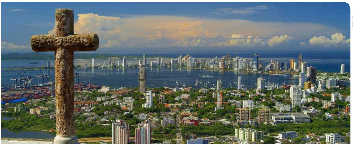
Cartagena de Indias, Colombia.