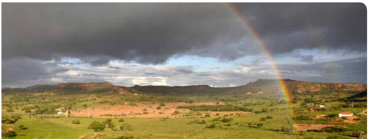
Arcoiris en el Sertão Brasileño.