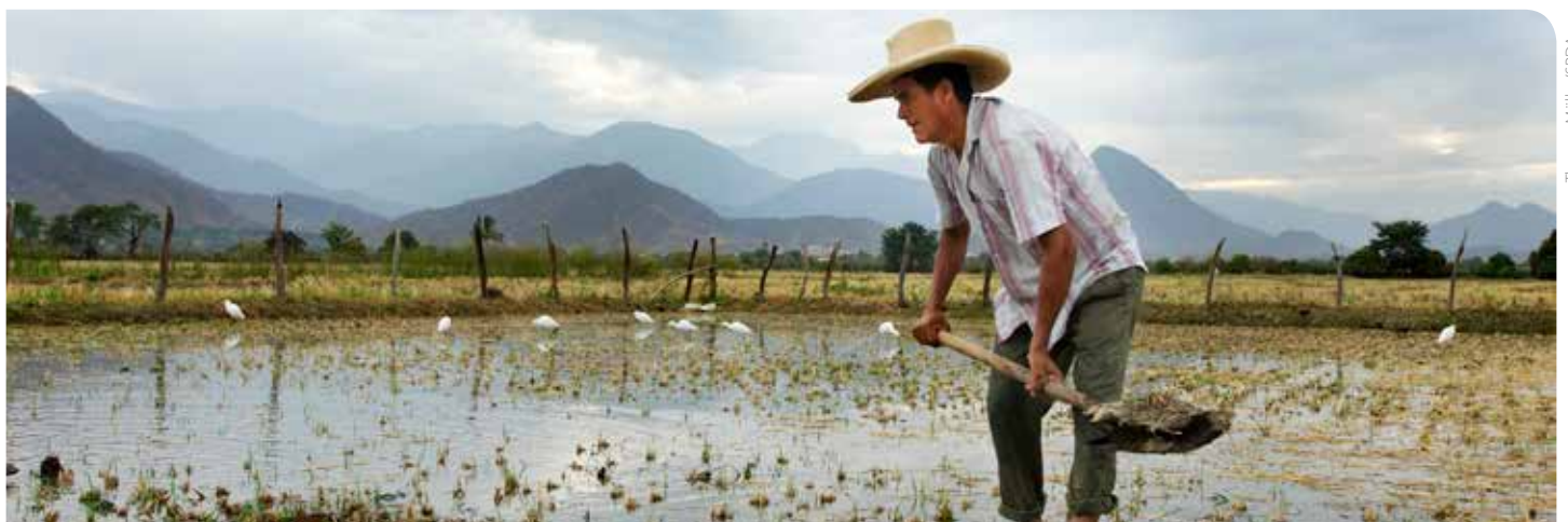
Campesino preparando el terreno para el cultivo de arroz, Morropón, Piura.