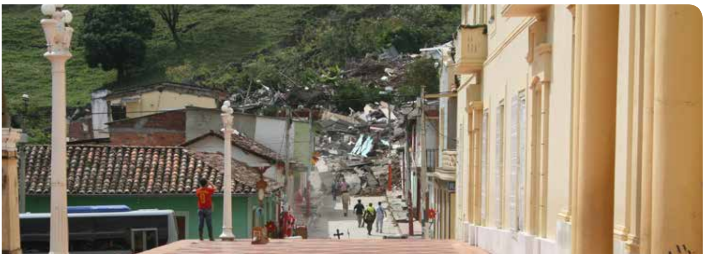
Dstrucción del municipio de Gramalote, Norte de Santander.