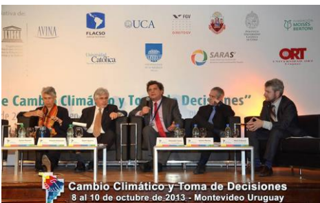
Cambio Climático y Toma de Decisiones 8 al 10 de octubre de 2013 - Montevideo Uruguay