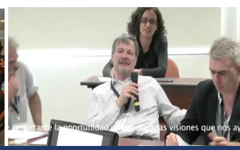
importante la oportunidad de escuchar tantas visiones que nos ay